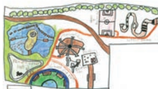
Scholieren van Openbare Basisschool Het Hof in Lichtenvoorde bedachten kansen en mogelijkheden voor het park.

Twaalf Gelderse gemeenten hebben subsidie gekregen voor de inrichting van een Cool Nature-park: fantasierijke natuurspeelplekken van minimaal twee hectare, dicht bij de bewoners in het dorp of buurt. Sommige gemeenten integreerden de speelplekken in bestaande plannen, functies combinerend. Ergens anders werd een gebied opnieuw ingericht. In de meeste gemeenten is het project opgepakt vanuit de afdeling(en) groen, spelen en ruimtelijke ontwikkeling. Maar ook andere afdelingen werden bij het project betrokken.