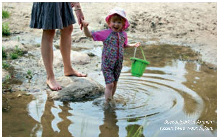
Beekdalpark in Arnhem tussen twee woonwijken.

Cool Nature is 23 mei 2013 afgesloten met een symposium in Arnhem. Voor Groen maken we een kleine ronde langs de velden. Wat heeft het opgeleverd en hoe gaat het verder?