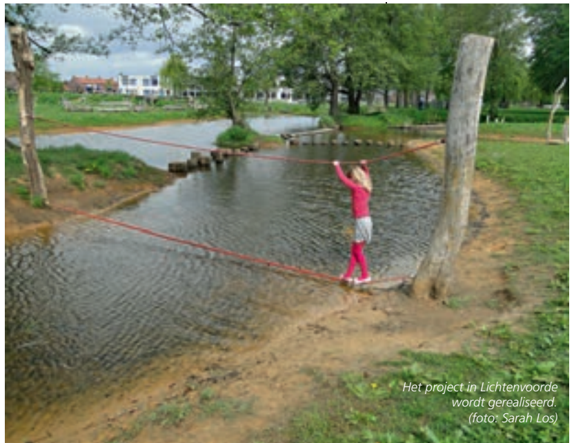
Het project in Lichtenvoorde wordt gerealiseerd.