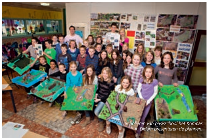
Scholieren van basisschool het Kompas in Didam presenteren de plannen.