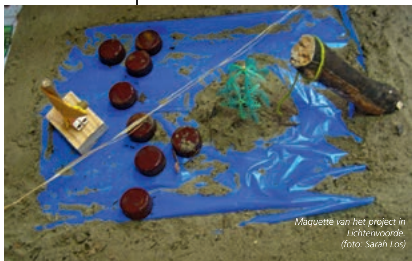
Maquette van het project in Lichtenvoorde.