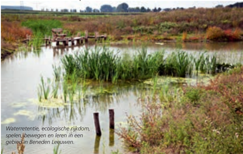
Waterretentie, ecologische rijkdom, spelen, bewegen en leren in een gebied in Beneden Leeuwen.